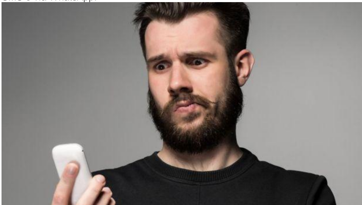
¿Tu amigo te envía mensajes "extraños"? Es posible que su terminal (o el tuyo) haya sido hackeado.

Es probable que sean sus amigos o familiares quienes perciban esta señal antes que tú, si es su dispositivo el que está enviando los mensajes, ya sea a través de SMS o vía WhatsApp.