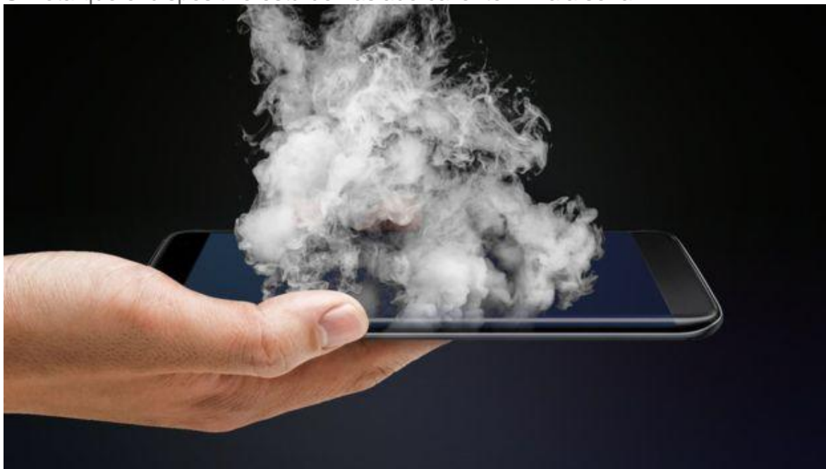
Si la temperatura del celular sube... mala señal.

Si nota que el dispositivo está demasiado caliente... mala señal.