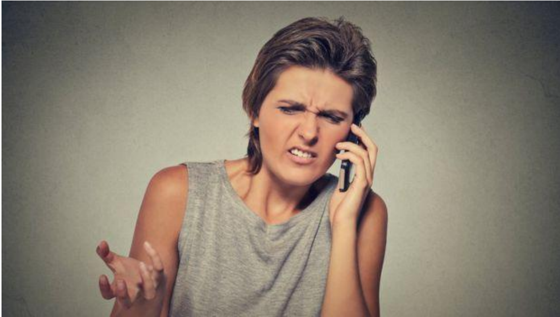
¿Escuchas un ruido extraño? ¿Pitidos? ¿Voces?

Esta razón también podría explicar comportamientos inusuales del sistema.